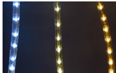
helderwit creamwit-yw warmwit